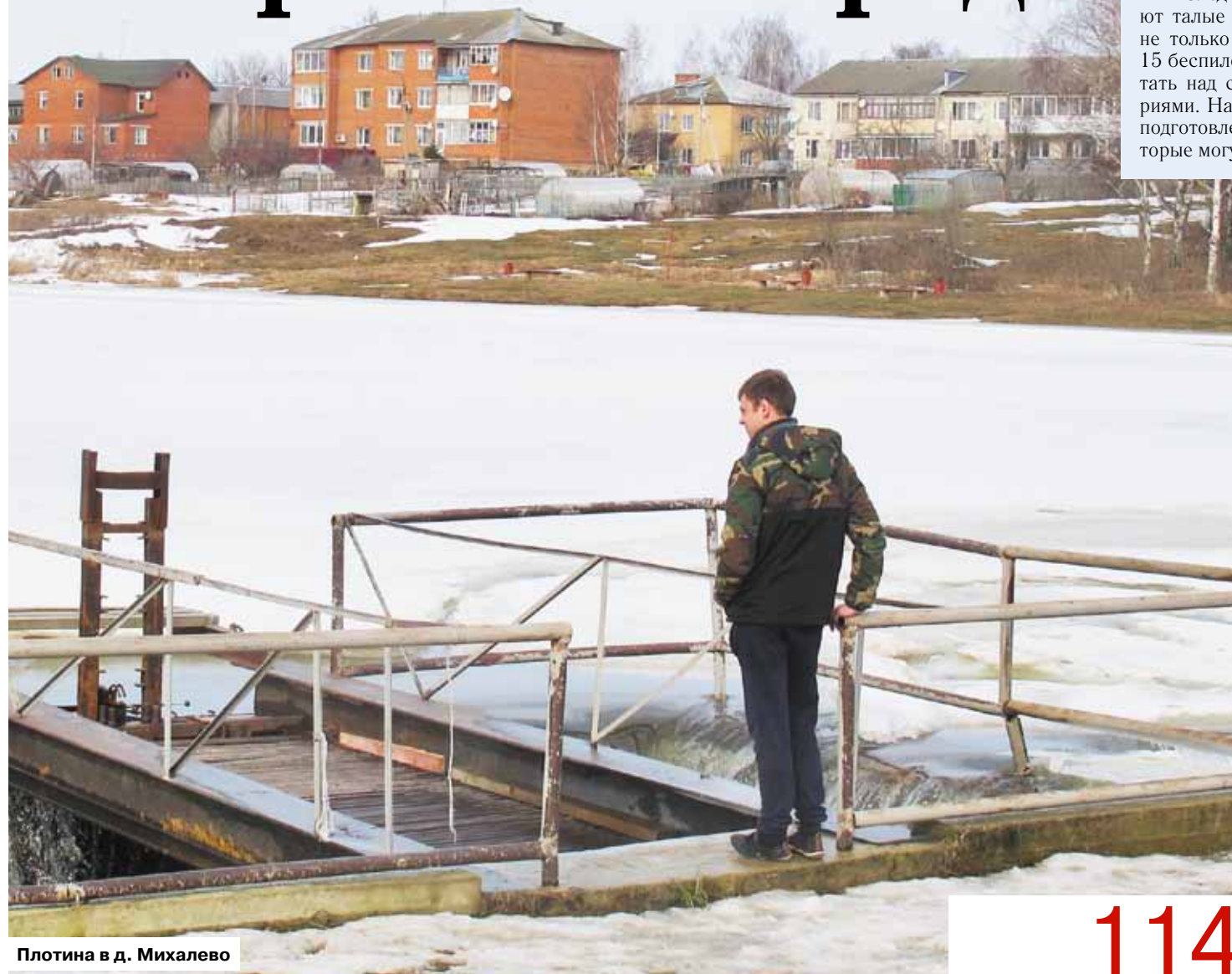
Плотина в д. Михалево

Специалисты МЧС прогнозируют: паводок придет в Подмоскowie во второй половине марта, а завершится в 20-х числах апреля. Хотя ожидается, что половодье пройдет без критических ситуаций, которые обычно случаются, когда минусовые температуры марта резко сменяются апрельским плюсом, все службы и ведомства регионов перешли в режим повышенной готовности.